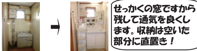
せっかくの窓ですから残して通気を良くします。収納は空いた部分に直置き！

洗面台の正面に窓があるので、これは活かしたまま洗面台の土台部分だけ取り換えて、鏡はオシャレな枠がついた物をニトリで購入しました。収納の代わりに小さなカゴをパネル壁に取り付けます。