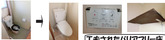
工夫されたバリアフリー床！

トイレの便器は全自動節水型の温水洗浄暖房便座です。工事をしている途中で、洗面所とトイレの床に段差がある事に気づき、大工さんに取り外しが可能なバリアフリー床を特注で作って貰いました。将来トイレの修理が発生した時に取り外す必要があるからです。