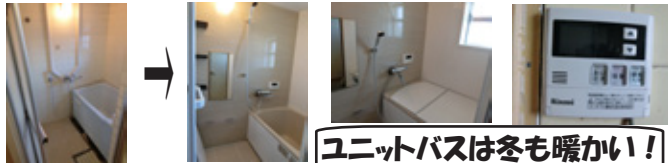
ユニットバスは冬も暖かい！

給湯器でお湯だけしか出なかったタイル壁の浴槽は、追い炊き浴槽のユニットバスへ。浴室の壁の内側にもう1つ壁を作るので、浴槽は少し小さくなりますが、水道代が安くなります。夏はシャワーだけ浴びる事も多いですし。