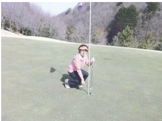
ゴルフを 開始後5回 目の バーディー でした