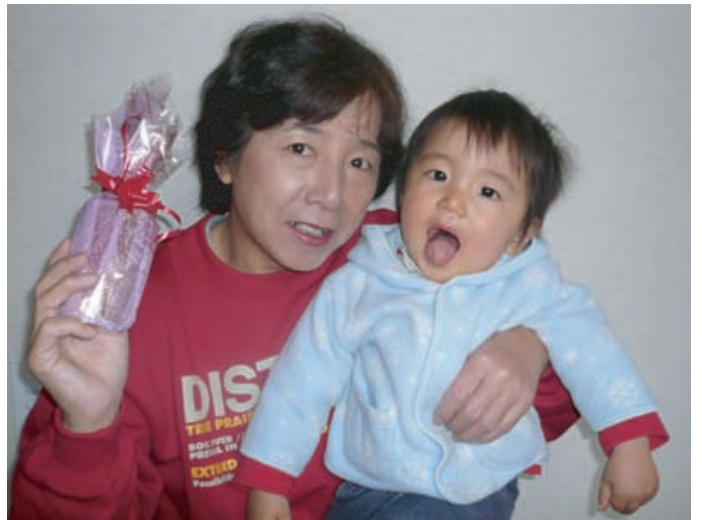
ひびき君から貰ったプレゼントとアッカンベーみつき君

「不動産選びは、まず不動産会社選びから始める時代です！」厳しい考え方、それは大きなサービスにつながります。