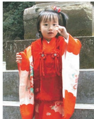
今年も良い年でありますように

困った人だから断るのですが、そんな人に対して断りを入れると、当然一時的にトラブルになります。