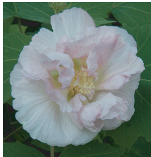
咲いた花が一日で赤く 染まる「醉芙蓉」