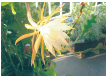
たった一日だけしか咲かない 「月下美人」朝に咲き、夕方に 散るはかなくも美しい花！

若い営業マンでは、解決できない問題も多いです。経験豊富なマンションセンターさいたまに是非ご相談下さい。