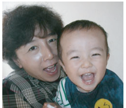
大切な家族の安全を守りましょう！