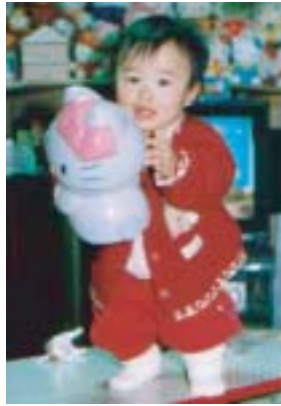
元気なカワイイ赤ちゃん

引き渡しを受けると、今度はリフォームです。早速、お見積もりを提出します。また前の方が使われていた鍵は、少し不安がありますので、鍵の交換もします。また、火災保険にも入って頂きました。折角購入した立派な家も火災や事故に遭ってしまえば、すべて失ってしまいます。